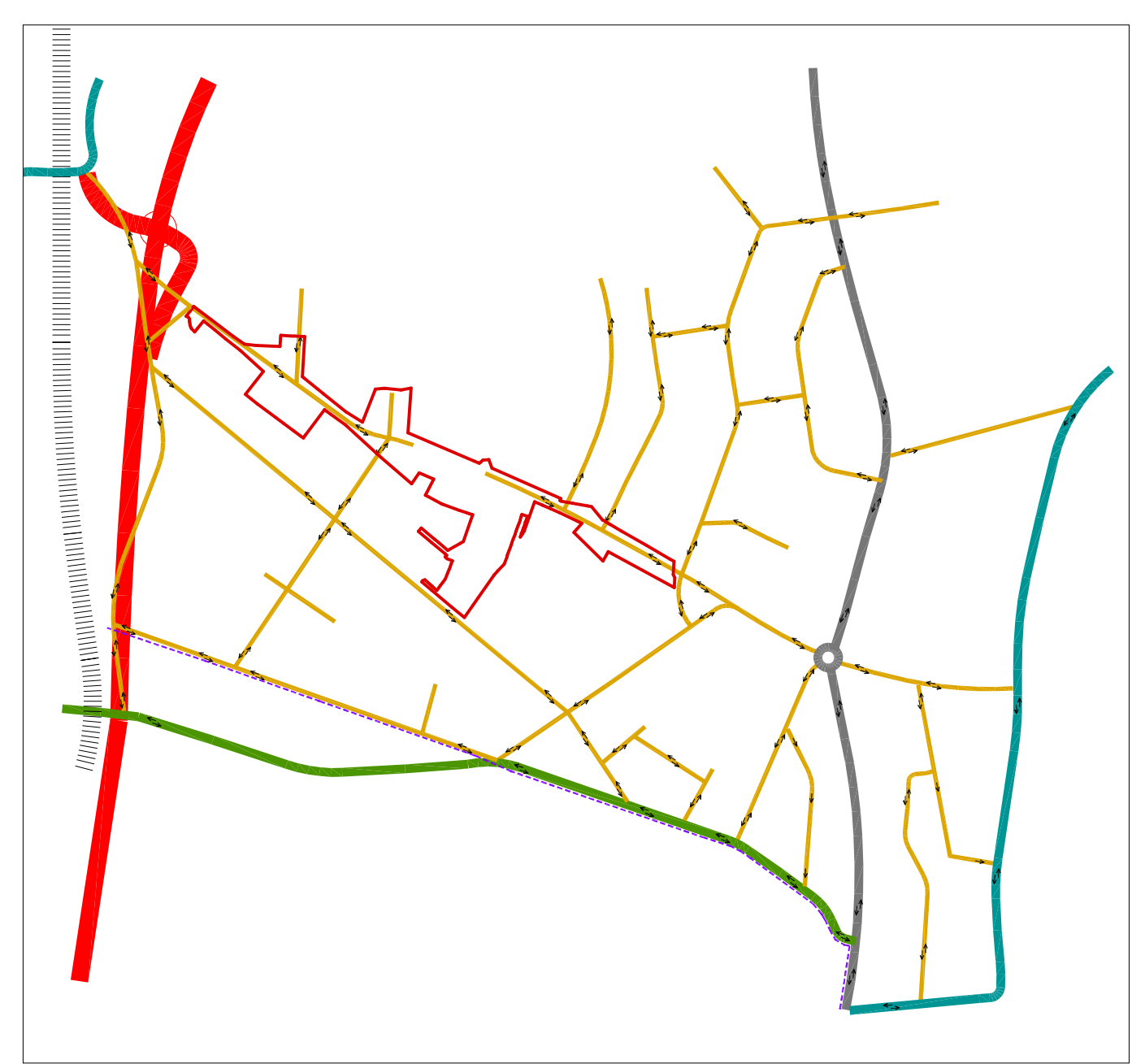
PŘEHLEDKA m 1:7 000